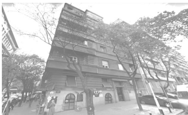
Sjedište Fondacije „Antun Gustav Matoš“ u Beogradu

Plan za 2022. godinu jest da se nastavi opremanje prostorija prema izrađenom dizajnu interijera.