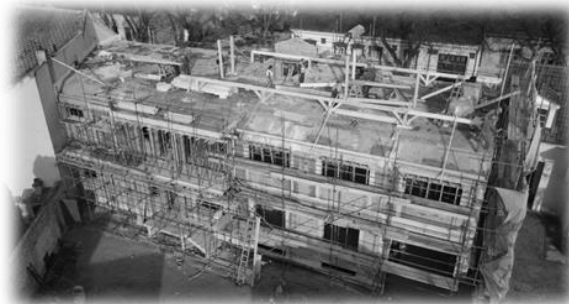
„Hrvatska kuća“ u izgradnji

Plan za 2022. godinu jest da sjedište krovne institucije bude u novom objektu „Hrvatske kuće“ na adresi Preradovićeva br. 11 i da se do konca godine on opremi i stavi u funkciju. Plan je, također, da se u taj objekt preseli redakcija i rukovodstvo NIU-a „Hrvatska riječ“ te da se u njemu nalazi i sjedište Fondacije „Cro-Fond“.