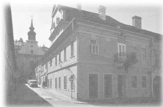
Rodna kuća Josipa bana Jelačića u Petrovaradinu

Plan za 2022. godinu jest da se obnovi dio rodne kuće (prizemlje i stan na prvom katu) i obnovljeni prostor stavi u funkciju.