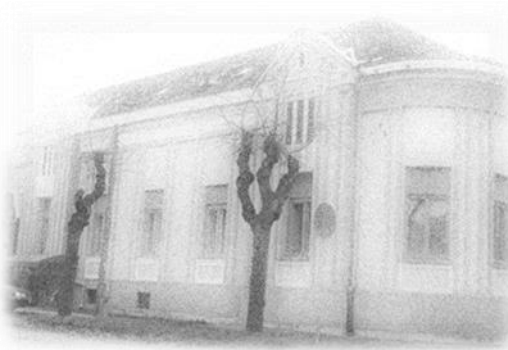
Zgrada Hrvatskog nacionalnog vijeća u Republici Srbiji i Zavoda za kulturu vojvođanskih Hrvata

Sjedište HNV-a nalazi se u Subotici, Preradovićeva br. 13.